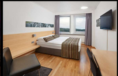
***รูปภาพเพื่อประกอบการโฆษณาเท่านั้น***

วันที่สี่ของการเดินทาง ล่องเรือชมวาฬ – เส้นทางวงกลมทองคำ